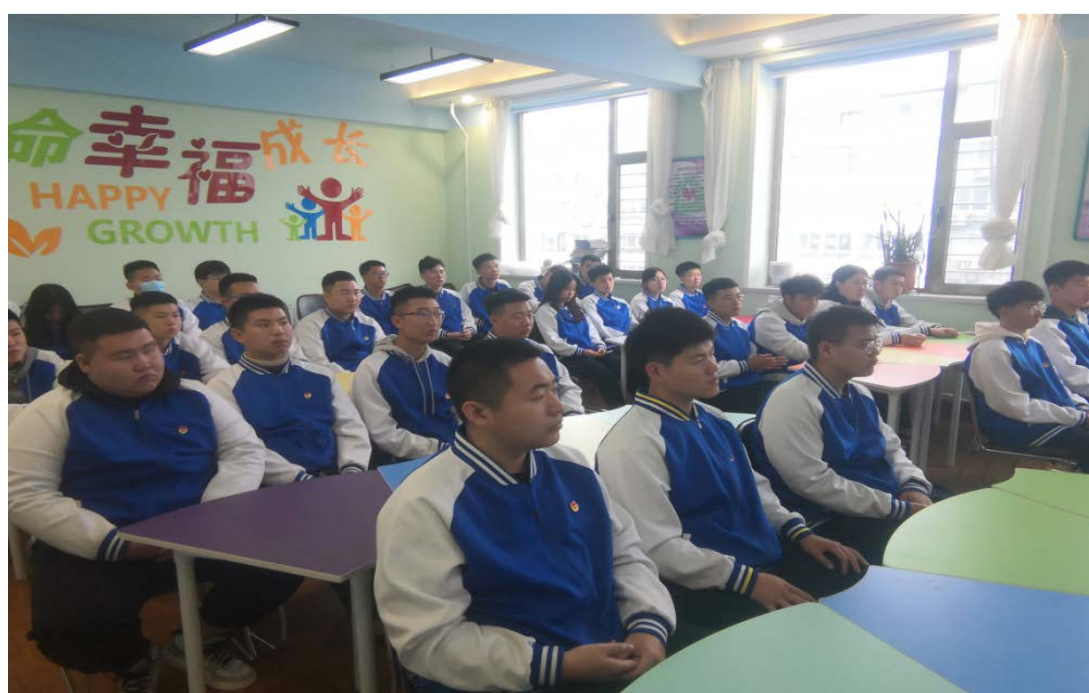
图为线上线下专职心理辅导员和心理委员培训现场