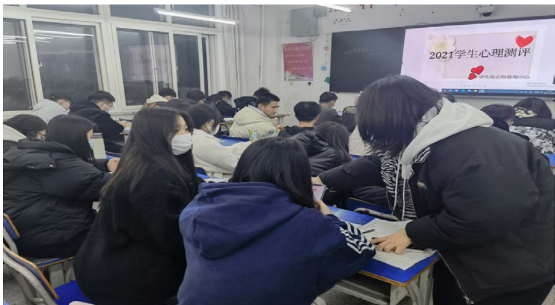
图为心理测评工作现场